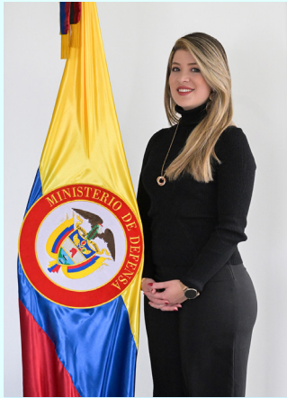
Por: Alexandra González Zapata

Secretaria de Gabinete del Ministerio de Defensa Nacional