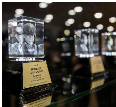
Iniciativa de memoria "Una luz de esperanza"

Este plan interinstitucional se organiza en tres ejes esenciales. El primero consiste en integrar capacidades y recursos para impulsar una búsqueda conjunta y evitar la dispersión de información. El segundo busca fortalecer, dentro de la Fuerza Pública, la comprensión del mandato humanitario de la UBPD mediante acciones pedagógicas. El tercero se enfoca en facilitar el acceso y el flujo de información entre entidades estatales, sin distinción de caso, territorio o posibles responsables, con el fin de avanzar en la búsqueda de todas las personas desaparecidas.