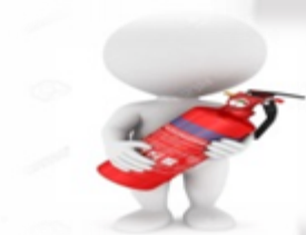
UBICACIÓN DE EXTINTORES Y ELEMENTOS DE SEGURIDAD