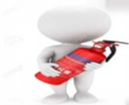
UBICACIÓN DE EXTINTORES Y ELEMENTOS DE SEGURIDAD