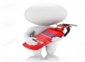
UBICACIÓN DE EXTINTORES Y ELEMENTOS DE SEGURIDAD