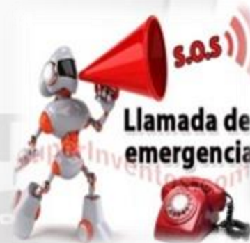
LLAMADA DE EMERGENCIA