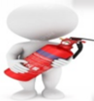
UBICACIÓN DE EXTINTORES Y ELEMENTOS DE SEGURIDAD