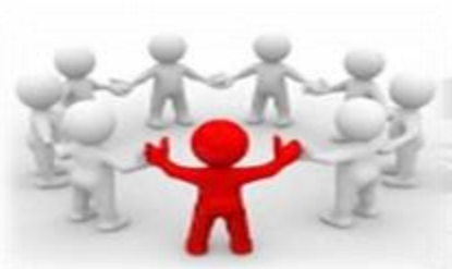
PUNTO DE ENCUENTRO