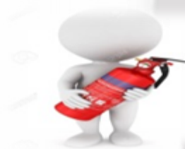
UBICACIÓN DE EXTINTORES Y ELEMENTOS DE SEGURIDAD