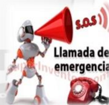
LLAMADA DE EMERGENCIA